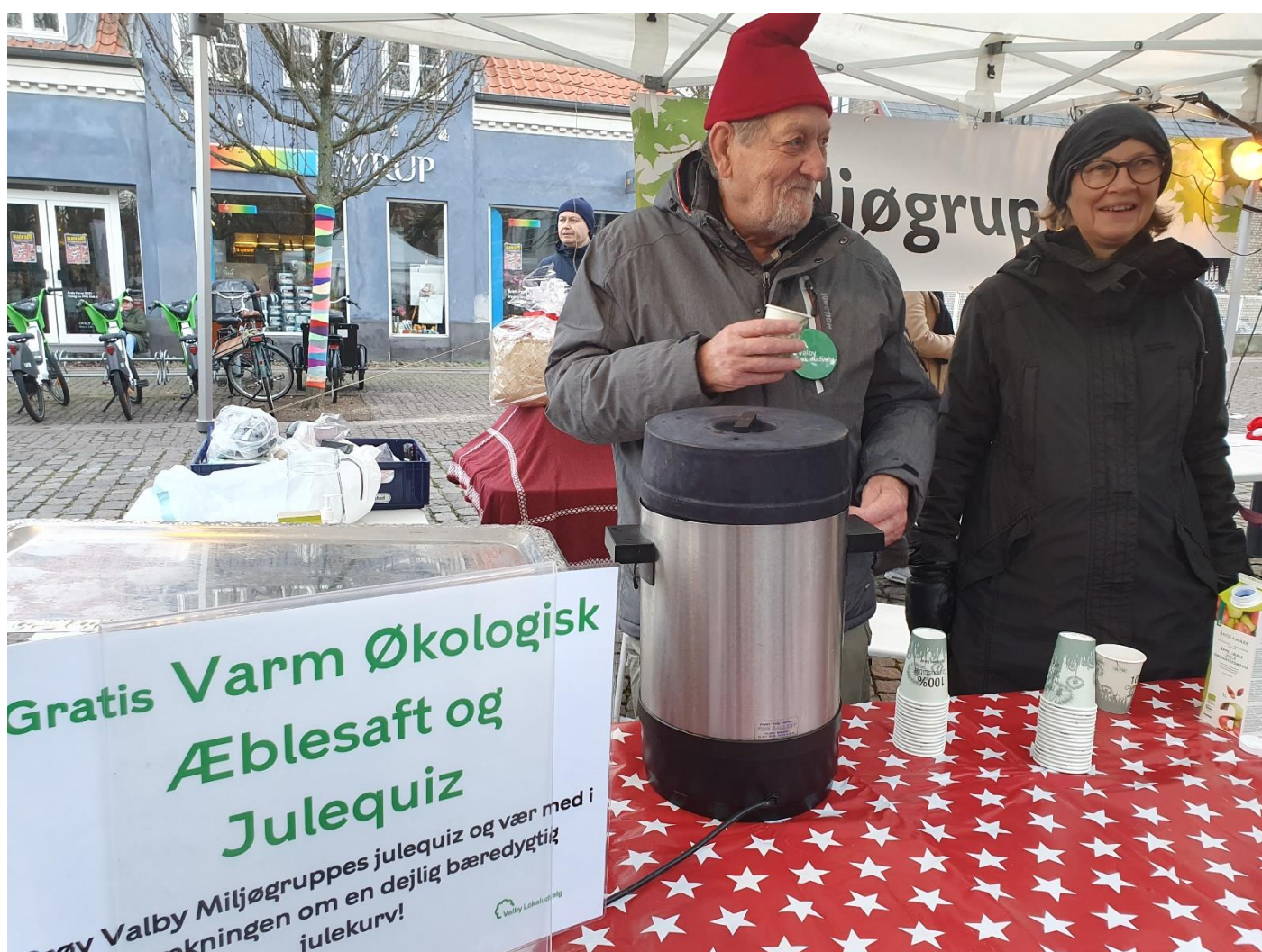
7: Miljøgruppen til Juletræstænding på Valby Tingsted

Miljøgruppens medlemmer og miljømedarbejderen deltager aktivt i relevante netværk, arbejds- og styregrupper.