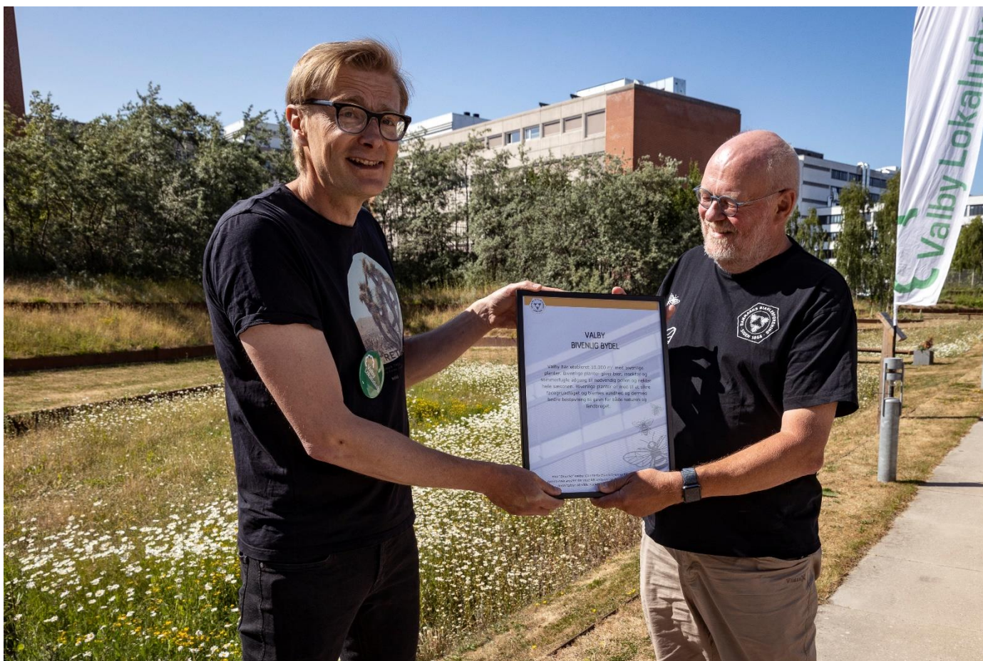
6: Valby-planen får overrakt "Valby Bivenlig bydel" diplom ved fejring af de første 5 HA biodiversitetsvenligt beplantet jord i Valby.