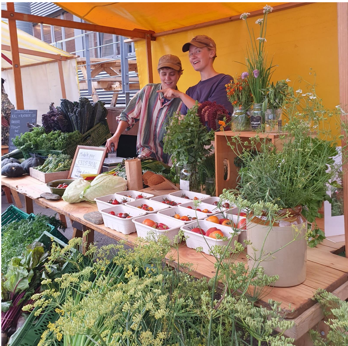
3: Grøn Madfestival på Hotel- og Restaurantskolen