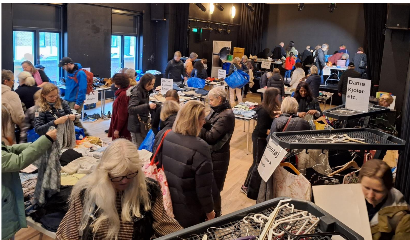
5: Byttemarked i Teatersalen

Vi vil desuden undersøge, om det er muligt at lave en indsats for at fremme bytterum, byttehylder og deleordninger hos bydelens ejendomsforeninger.