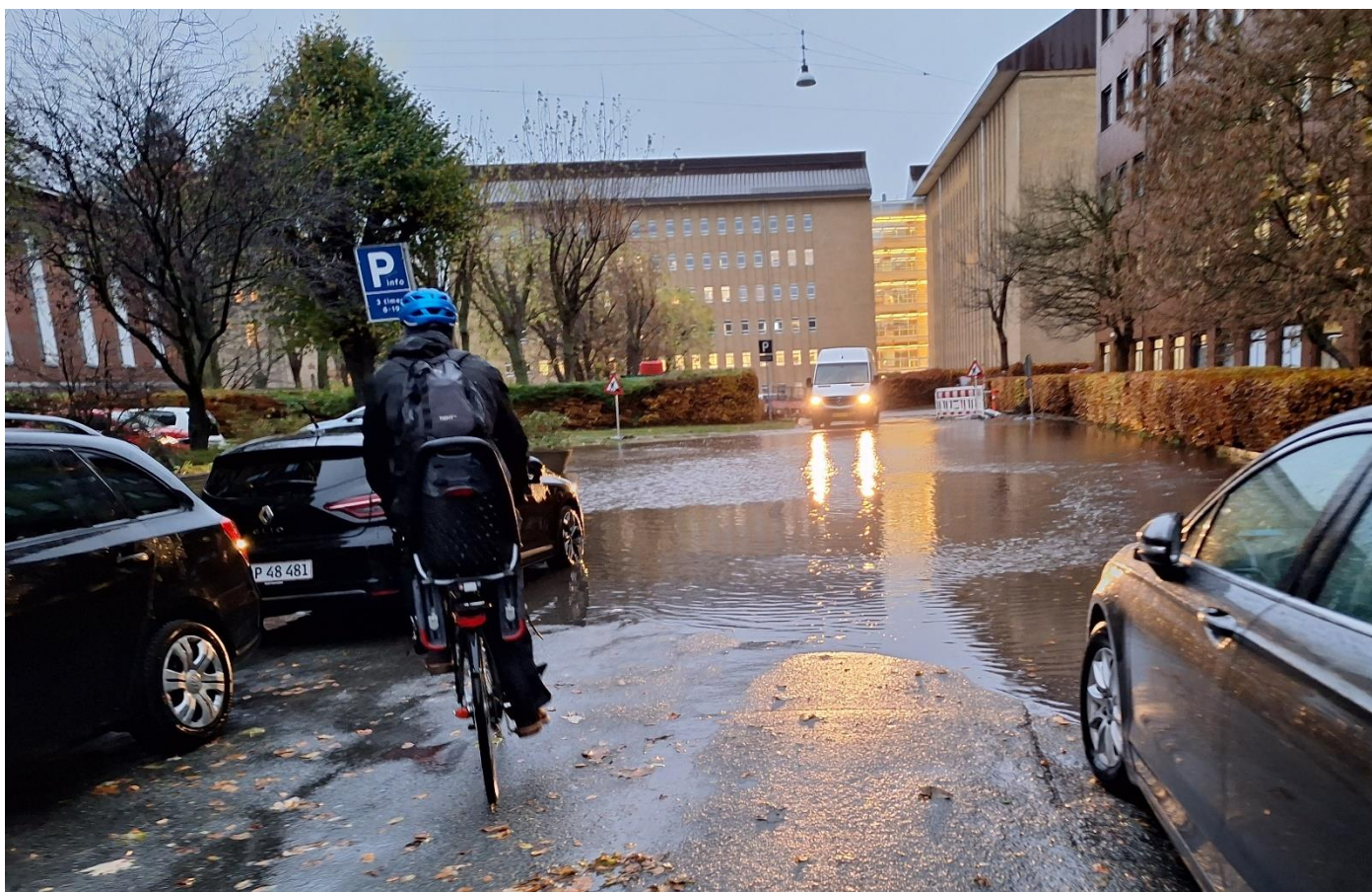
2: Voldsomt vejr november 2023

Valby Bydelsplans trafikprojekter vil fra 2024 blive behandlet i et tværgående udvalg, der har sit eget budget.