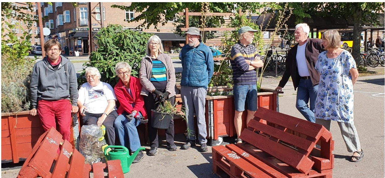
1. Aktive i Valby Miljøgruppe

Coronakrisen kan forventes i lang tid endnu at lægge hindringer for mange af vore gængse måder at møde borgerne. Vi vil stadig planlægge fysiske aktiviteter, men i det omfang restriktioner begrænser dette, vil vi udvikle andre måder at oplyse og inspirere på. Vi vil bl.a. optage korte lokale film, der kan illustrere klimaproblematikkerne med billeder og vinkler fra Valby