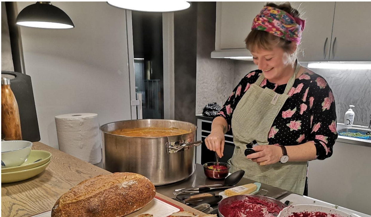
3. Klimakærlig mad, Gulerodskrigeren i køkkenet