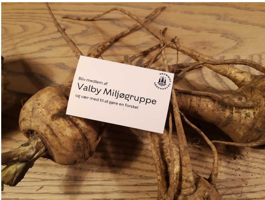
4. Valby Miljøgruppe er åben for alle der ønsker at gøre en forskel for miljø, klima og natur i Valby

Sekretariatet varetager udlån af en ladcykel og en æblepresse til borgere i Valby. Æblepressen for at støtte op om indsatsen mod madspild og synliggøre potentialet for at dyrke i byen. Ladcyklen udlånes for at gøre opmærksom på alternativer til biltransport.