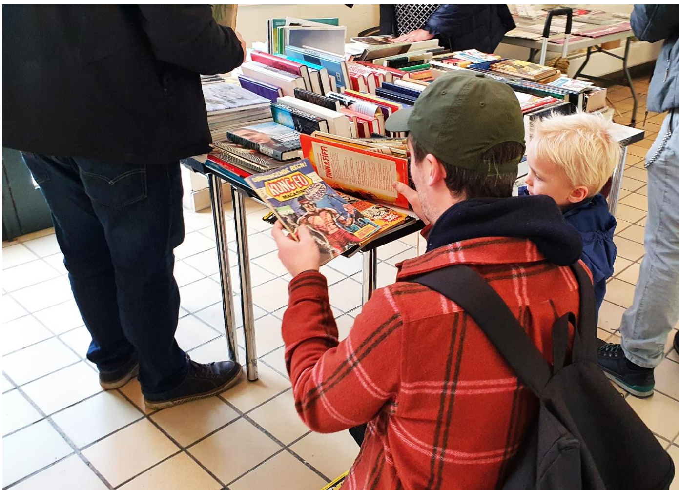
3: Byttemarked i Teatersalen