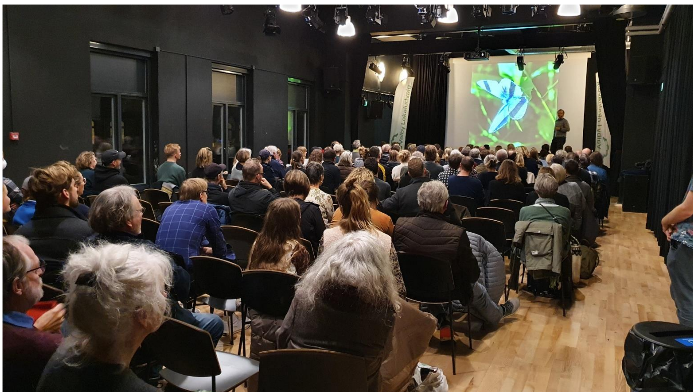
1: Biodiversitetsforedrag med Frank Erichsen aka Bonderøven i Teatersalen