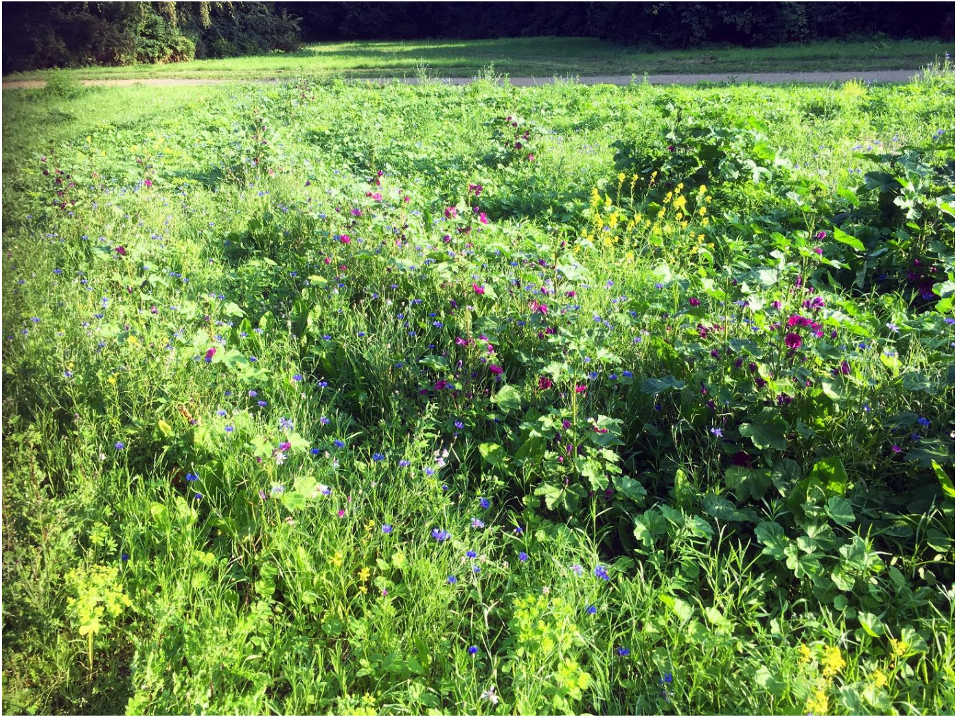
4: Vilde blomster i Valby parken