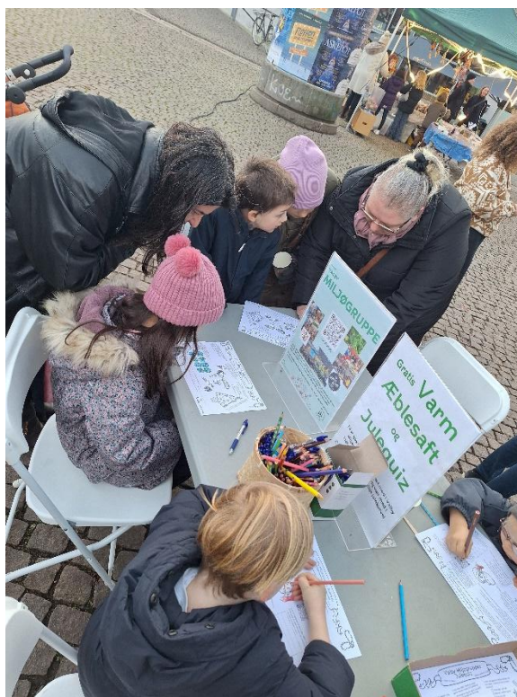
5. Miljøgruppen stiller op med Varm økologisk æblesaft og grøn julequiz til juletræstænding på Tingstedet