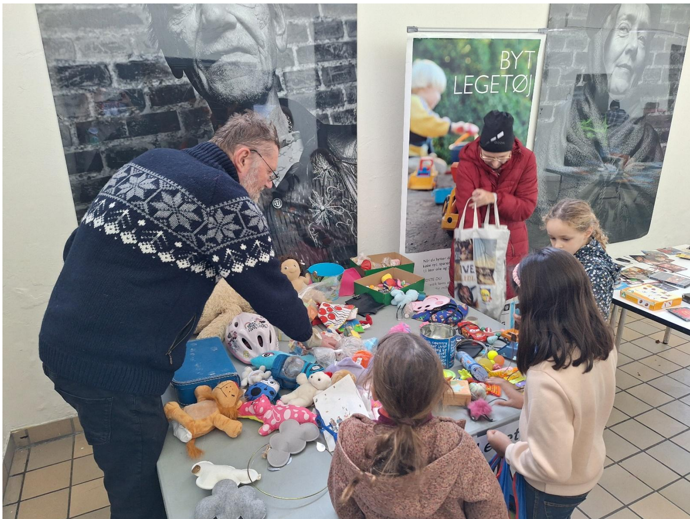
8. Der byttes legetøj ved årets Byttemarked i Teatersalen.

Vi vil igen i 2026 afholde vores traditionsrige byttemarked i Teatersalen og evt. støtte andre byttemarkeder i bydelen.