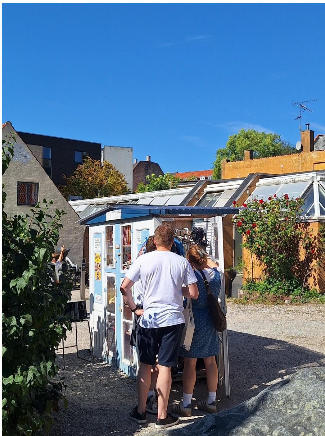
7. Trængsel ved Bytteøen foran Valby Bibliotek / Rytterskolen

Vi vil desuden undersøge, om det er muligt at lave en indsats for at fremme bytterum, byttehylder og deleordninger hos bydelens ejendomsforeninger.