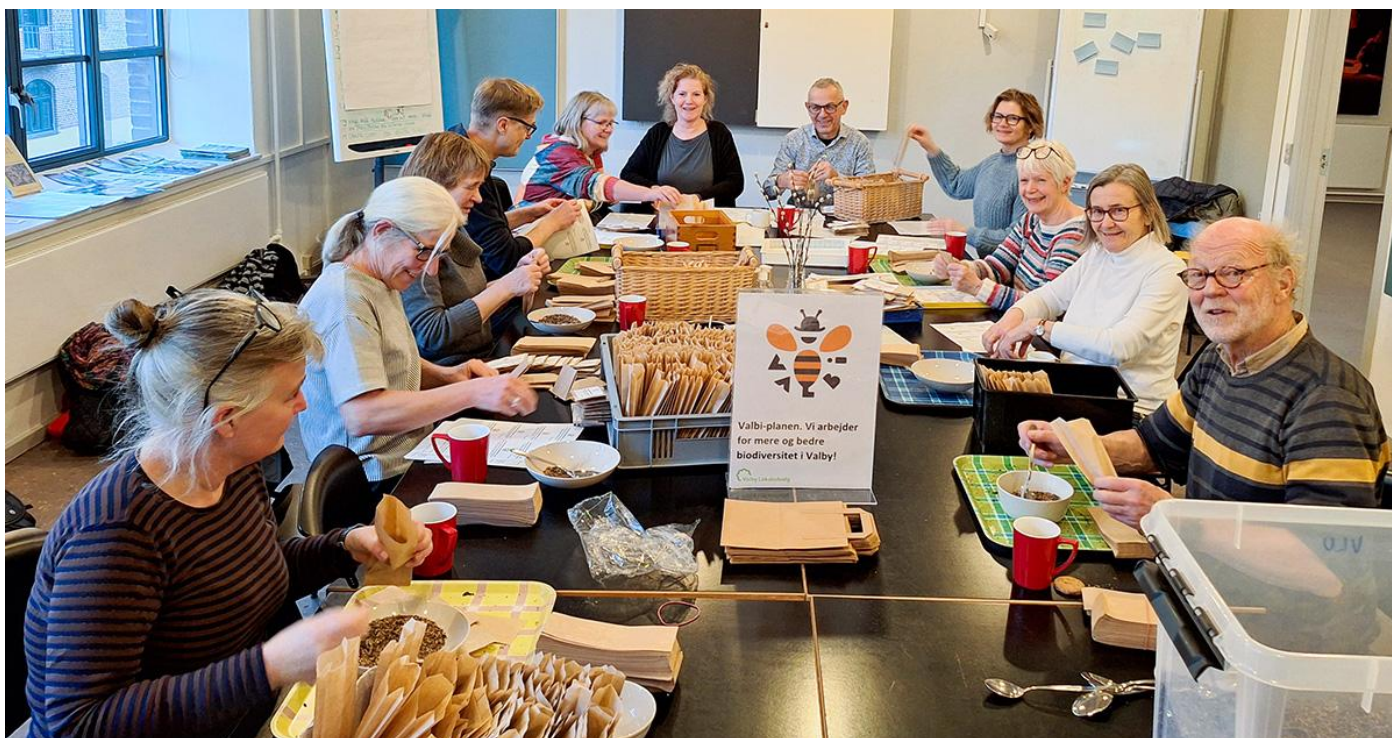
2. Miljøgruppens Valbi-plan biodiversitets arbejdsgruppe pakker frøposer til uddeling

Hvert efterår udarbejder Miljøgruppen årsplan og budget for det kommende års arbejde. Årsplan og budget forelægges for og vedtages af Valby Lokaludvalg og kan til en hver tid findes på Lokaludvalget hjemmeside.