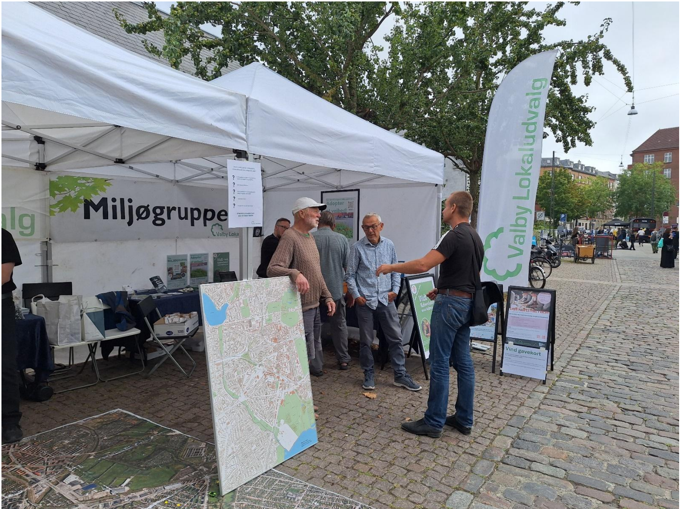
1. Valby Miljøgruppe på Valby Dage

Vi vil arbejde med projekterne i Valby Lokaludvalgs bydelsplan - flagskibsprojektet om færdiggørelse af den grønne cykelsti, ny trafikplan for Valby og begrønning af Toftegårds Plads Nord.